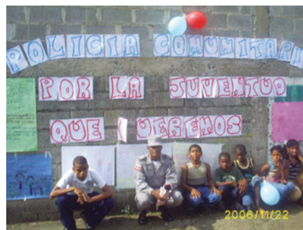
La participación ciudadana y la modernización de la Policía Nacional fueron pilares fundamentales para la implementación del Plan de Seguridad Democrática en la República Dominicana. Pero antes se realizó una exhaustiva etapa de investigación cualitativa y cuantitativa.

Pero para que el PSD sea integral, se exige la participación de las institucio-